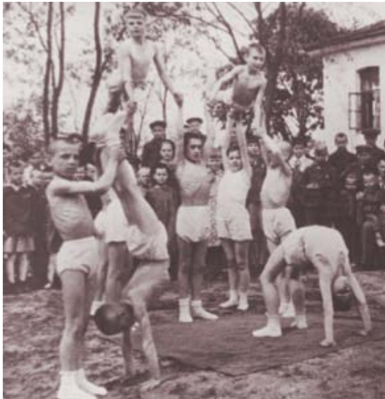
Репетиция праздника в детском доме.