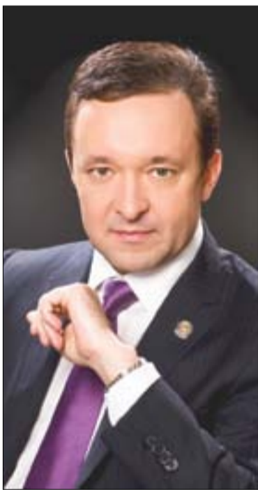
Ильдар Халиков, Премьер-министр Республики Татарстан, председатель Совета директоров ОАО «Генерирующая компания»