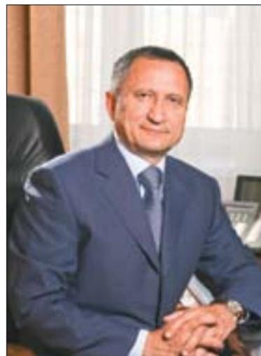
Эдвард Юнусович Абдуллазизов, ректор Казанского государственного энергетического университета

Дорогие друзья! От всей души поздравляю с нашим профессиональным праздником – Днём энергетика и наступающим Новым 2015 годом!